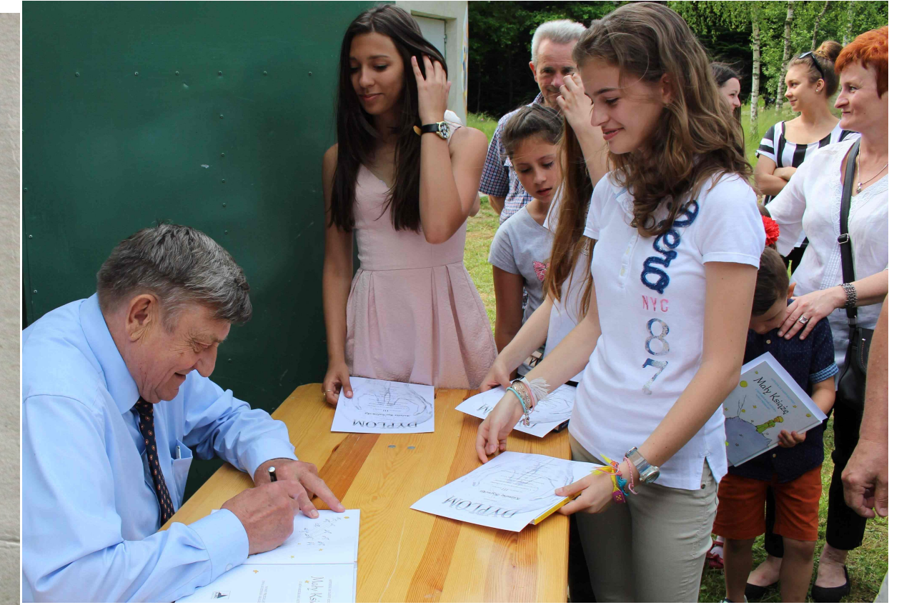
Autografy na dyplomach finalistów konkursu plastycznego Ars Astronomica . Rzepiennik, 2015.