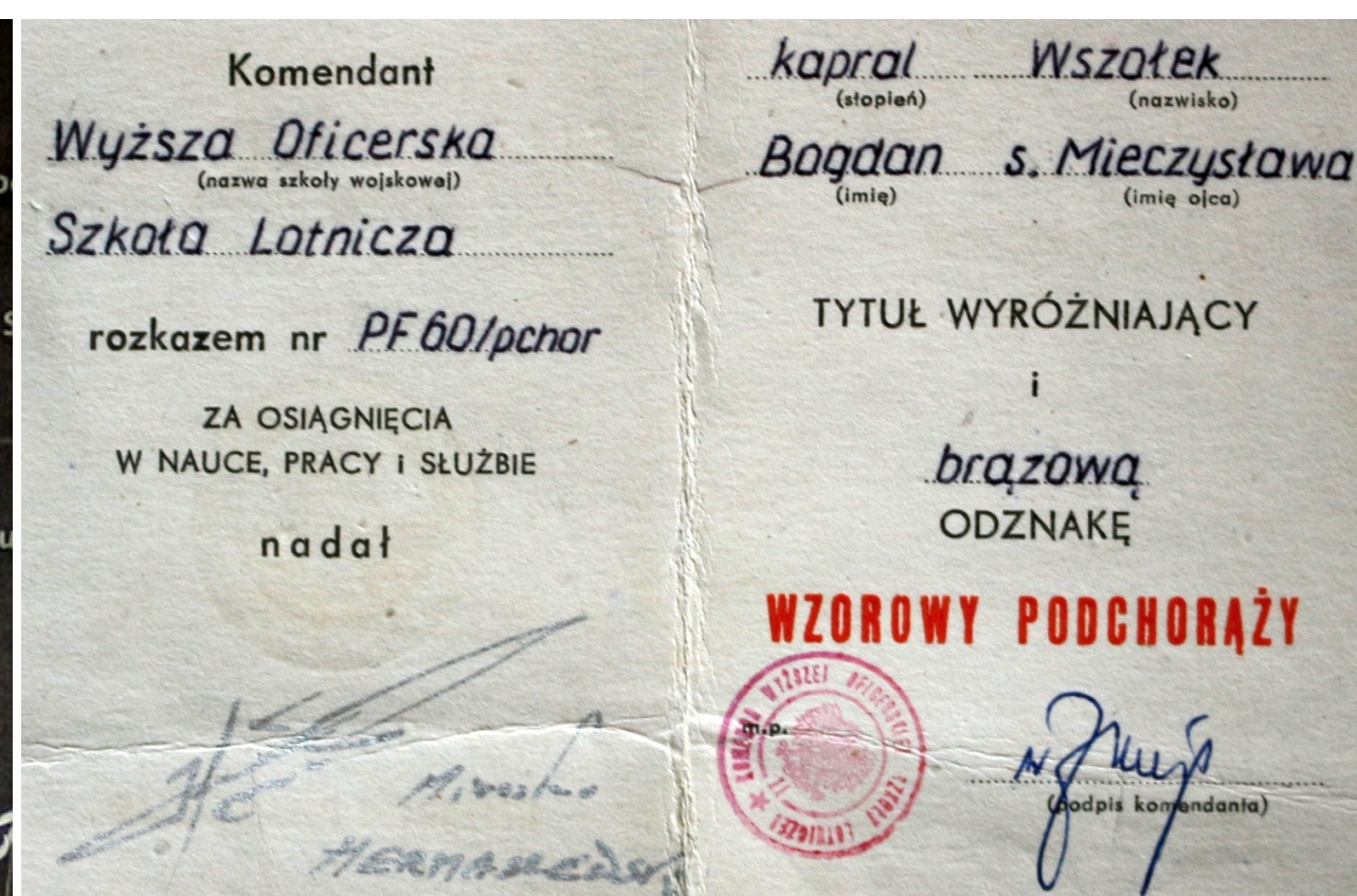
Wpis "potwierdzający" decyzję wcześniejszego Komendanta dęblińskiej WOSL. Kraków, 2013.