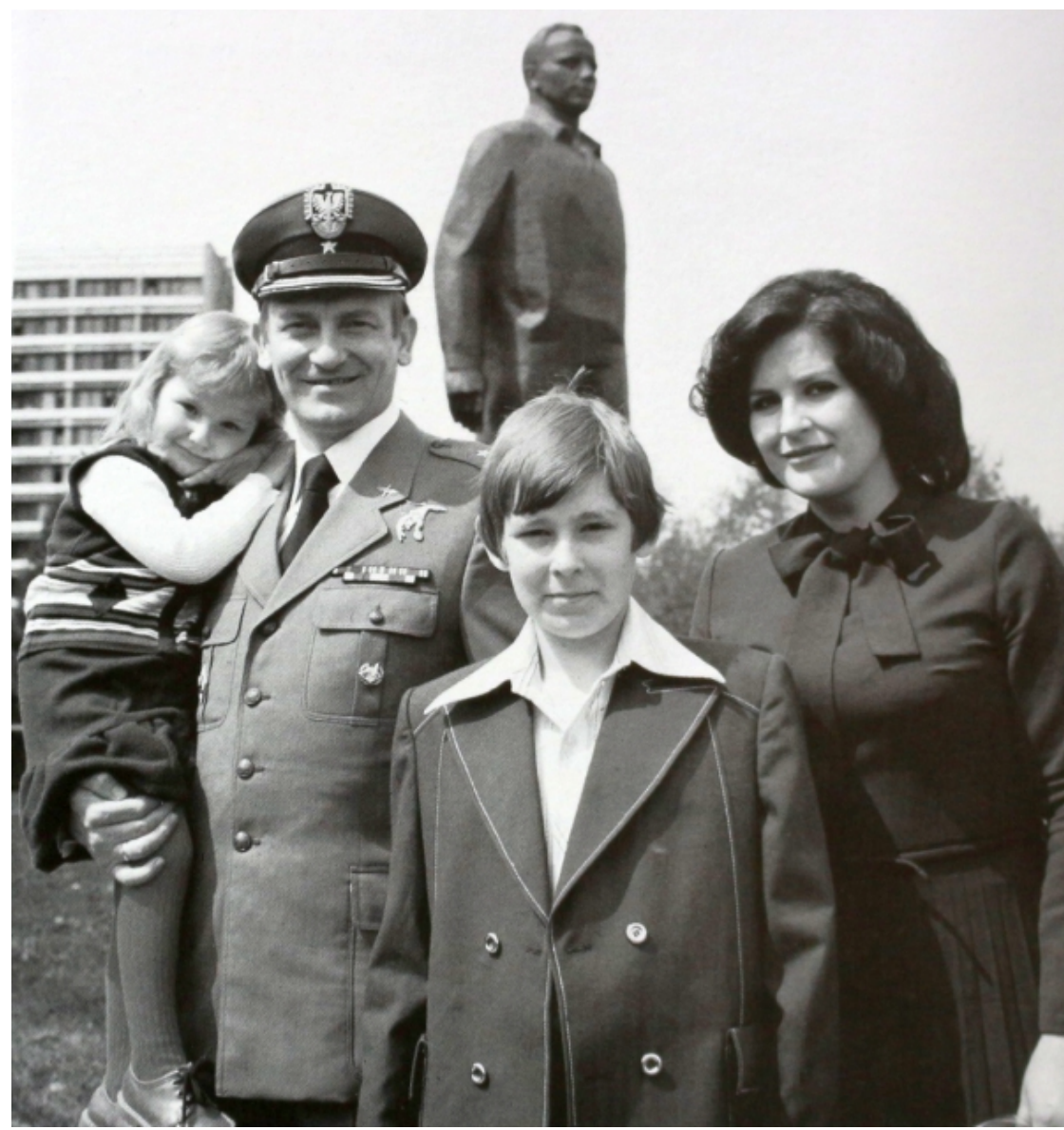
Rodzinnie przy pomniku Jurija Gagarina, przed lotem w kosmos.