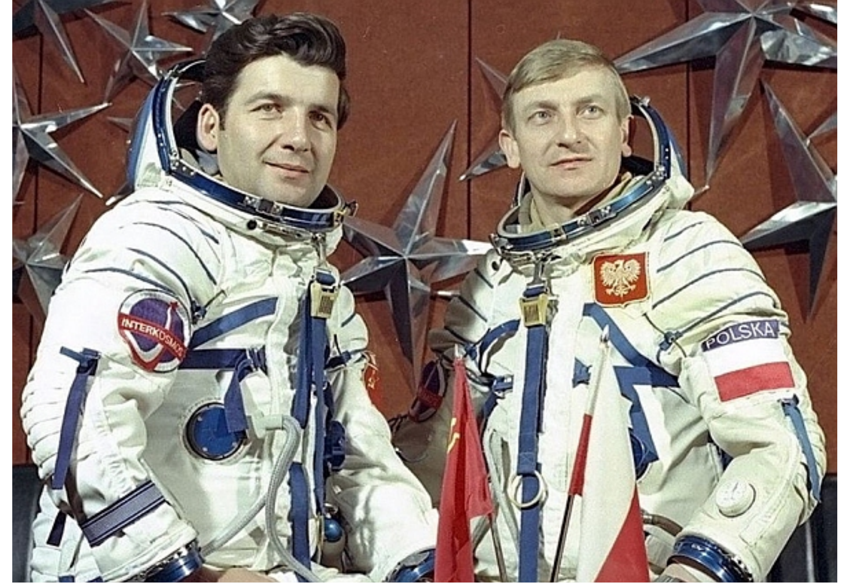
Piotr Klimuk i Mirosław Hermaszewski po ich wspólnym locie kosmicznym.