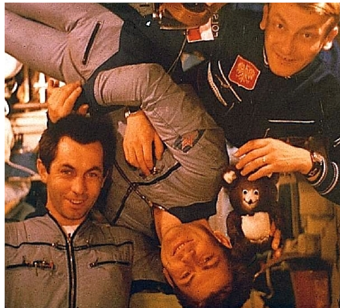
W stanie nieważkości na stacji orbitalnej.